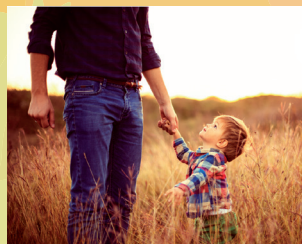
Wer macht Dich stark?