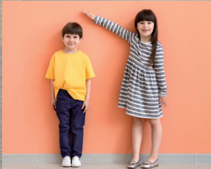
Ich bin ich