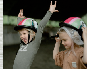
Gefühle & Glück