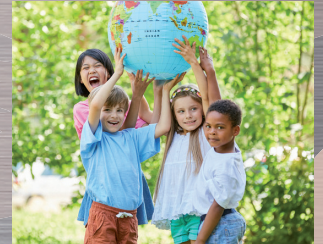
Regeln vs. Freiheit

Tragt unten in die vorgesehenen Linien eure Regeln in den jeweiligen Bereichen ein.